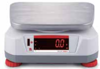
Rückwärtiges Display mit integriertem berührungslosen Sensor