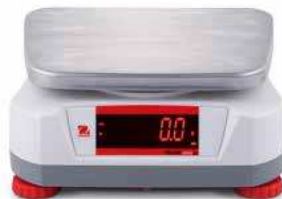
Display an der Rückseite